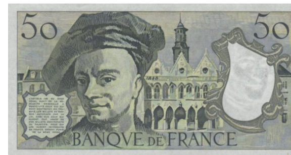
Son visage est connu du grand public grâce au billet de 50frs avec en arrière plan la mairie de Saint Quentin

En 1782, La Tour fonda à Saint-Quentin une école royale de dessin. Sa ville natale conserve aujourd'hui l'essentiel de son œuvre, qui constitue une véritable anthologie des personnalités qui marquèrent le siècle de Louis XV.